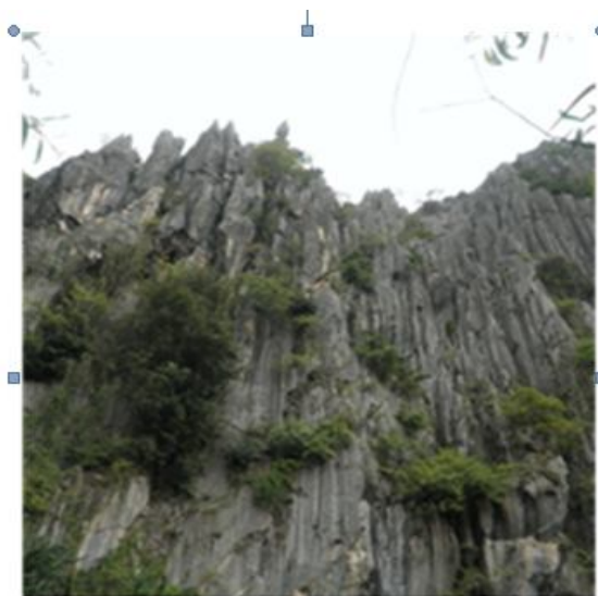
Hình 2. Hệ thống carut trên núi Bà Tài