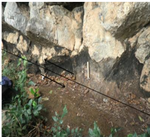
Hình 4. Đứt gãy nghịch chòm tại chân núi Thạch Động

Nhiều hóa thạch trong đá vôi Hà Tiên – Kiên Lương đã được phát hiện. Các hóa thạch này được các nhà cổ sinh vật học xác định là của nhiều loài cổ sinh vật khác nhau như san hô, huệ biển, trùng lỗ... Thông qua các hóa thạch này mà tuổi của đá vôi Hà Tiên – Kiên Lương được xác định là tuổi từ Cacbon sớm đến Triat giữa và môi trường cổ địa lí của khu vực là môi trường thềm và sườn lục địa tương đối yên tĩnh trong phần lớn giai đoạn này.