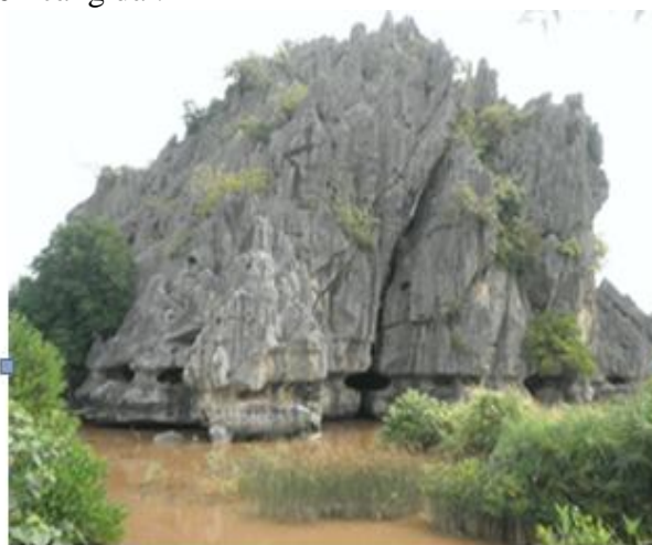
Hình 5. Các hang hàm ếch ở các độ cao khác nhau dưới chân núi Cây Ót

Hàm ếch là một dạng địa hình được hình thành do sự ăn mòn hóa học và xâm thực cơ học xảy ra ngay mực nước (sông, hồ, biển). Đối với các đá dễ hòa tan như đá vôi thì các địa hình hàm ếch càng dễ dàng được tạo thành. Các hang hàm ếch chính là những chạm trở địa mạo thể hiện mực nước ở hiện tại và trong quá khứ. Hàm ếch càng sâu thì thời gian bình ổn càng dài.