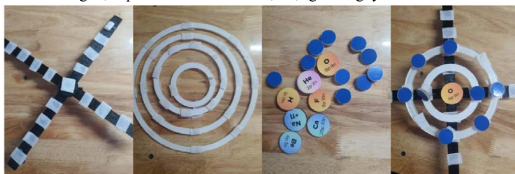
Hình 2. Hình ảnh đồ dùng hỗ trợ dạy học “Chong chóng nguyên tử”

Bộ đồ dùng bao gồm ba bộ phận chính: vòng cố định electron, trục chong chóng và hạt nhân kèm electron (tương ứng với 20 nguyên tố đầu tiên). Khi sử dụng, trước tiên cần xác định nguyên tố cần mô phỏng, sau đó chọn hạt nhân, số vòng cố định và số electron phù hợp. Mỗi vòng có số electron tối đa, tương ứng với số vị trí gắn electron trên vòng. Tiếp theo, tiến hành lắp ráp mô hình bằng cách gắn hạt nhân vào trung tâm của trục chong chóng, lắp vòng cố định electron vào phần ngoài của hạt nhân, sau đó gắn electron vào các vị trí tương ứng trên vòng quay theo nguyên tắc sắp xếp electron trong nguyên tử. Cuối cùng, thực hiện quay trục chong chóng để quan sát sự chuyển động của electron quanh hạt nhân, giúp học sinh hình dung trực quan về cấu trúc và hoạt động của nguyên tử.