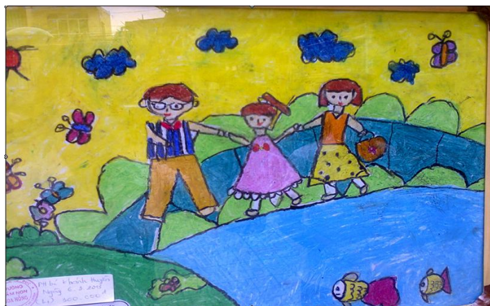
Hình 1. MST 07: Gia đình của bé (Bé: K-H)

• Phân tích cụ thể trên 2 tranh mẫu MST: 07 và 08 (xem hình 1 và 2)