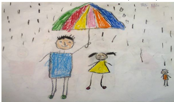
Hình 2. MST 08: Trời mưa (Bé: T-H)